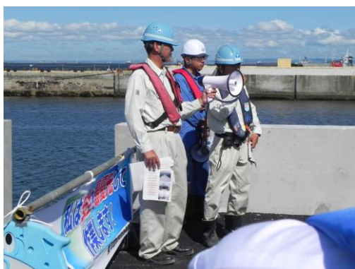
③ 東洋建設による説明