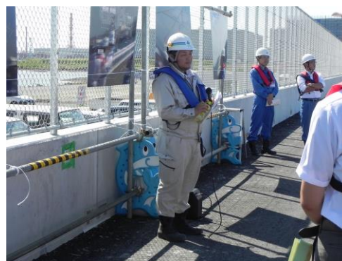
② 五洋建設による説明