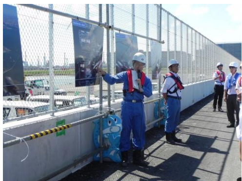
① 横浜市港湾局建設保全部による説明