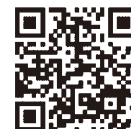
認証キーの取得方法 発注者への提出方法